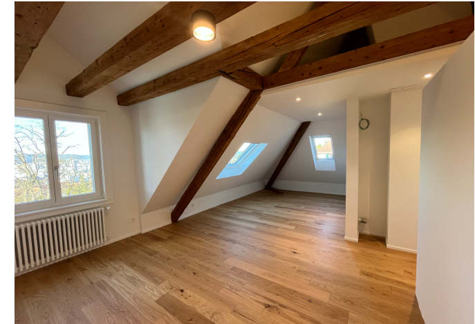
Best. Parkettboden Kinderzimmer