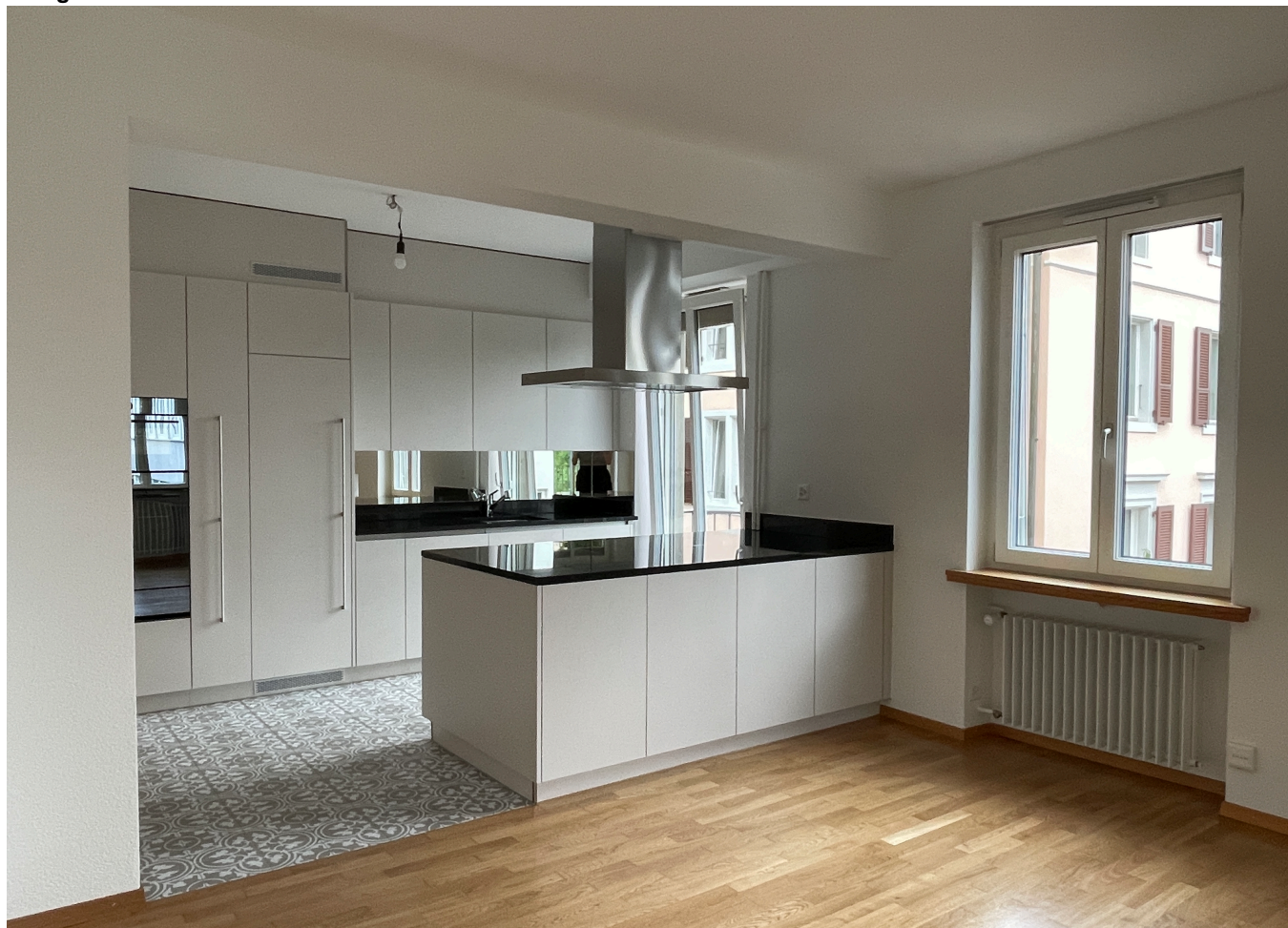
Neu geöffneter Wohnraum und Küche